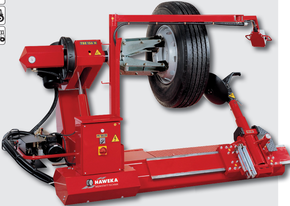
TBE 156 N