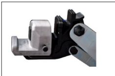
MFZ8-12100156 Spannbacken für Alufelgen für TBE 155 (1 Satz = 4 Stück) aus Aluminium mit Kunst- stoffeinsätzen