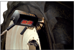
MF0-12300201 Pneumatischer Wulstab- drücker DM 120 für EM-Reifen