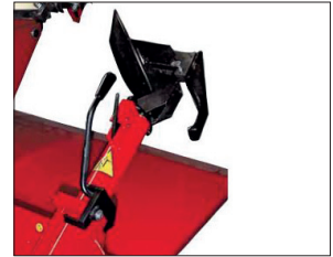
MAMFTB128N – Modell TB 128 N Ein- und Ausschwenken sowie Verschieben des Montagearms manuell.