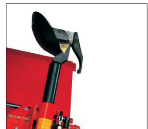
MAMFTB128DL – Modell TB 128 DeLuxe mit hydraulischem Ein- und Ausschwenken sowie Verfahren des Montagearms und 2 Drehgeschwindigkeiten.